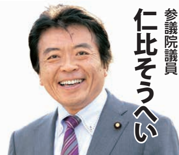
仁比さうへい 参議院議員