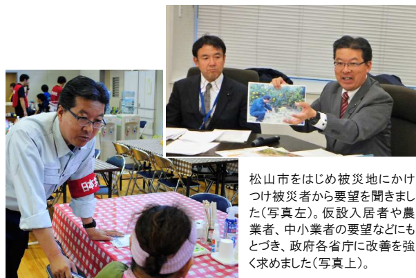
松山市をはじめ被災地にかけつけ被災者から要望を聞きました(写真左)。仮設入居者や農業者、中小業者の要望などにもとづき、政府各省庁に改善を強く求めました(写真上)。