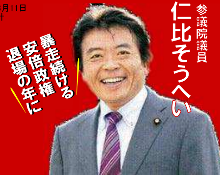
参議院議員 仁比そうへい